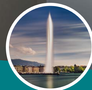
Genève à 35 min en voiture