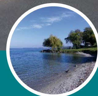
Plage des Recorts à 8 min à pied