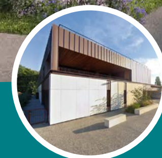
Groupe scolaire et médiathèque à 4 min à pied