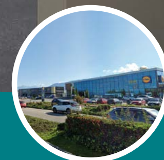
Zone commerciale Espace Léman à 2 min en voiture