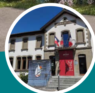
Mairie d'Anthy-sur-Léman à 2 min à pied